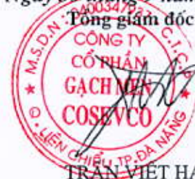
TRẦN VIỆT HẠ